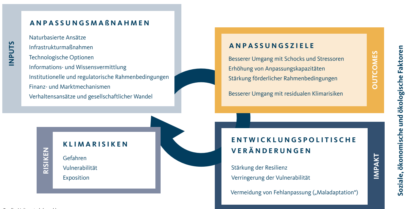
Abbildung 2 Theorie des Wandels zur Wirksamkeit von Anpassungsmaßnahmen

In der Evaluierung zeigen sich eindeutige und überwiegend positive Beiträge des deutschen Anpassungsportfolios zur Stärkung der Klimaresilienz und zur Verringerung von Vulnerabilität über die Ziele „besserer Umgang mit Schocks und Stressoren“ und „Erhöhung von Anpassungskapazitäten“ (vgl. Abbildung 2). Für das Ziel „Stärkung förderlicher Rahmenbedingungen“ bestehen aufgrund geringerer und konfligierender Evidenz hingegen Unsicherheiten